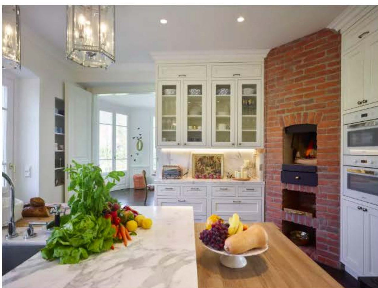
▲足以让一家人共享烹饪时光的超大厨房

A: 房子最近的一次装修, 还是在上世纪八十年代, 样式和功能显然已经不符合如今的需求。前期沟通中, 新任业主夫妇和我们分享了他们的审美偏好及生活习惯, 还特别叮嘱我们要充分考虑三个孩子的个性化需求。为了五口人分别作为家庭集体和独立个体的生活方式, 我们对房子的布局做了不少调整。