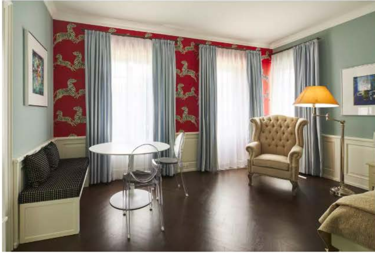
设计套卧时，Tordiglione 也丝毫没有懈怠，在各个房间内用墙纸营造出不同的氛围，让来客们宾至如归。