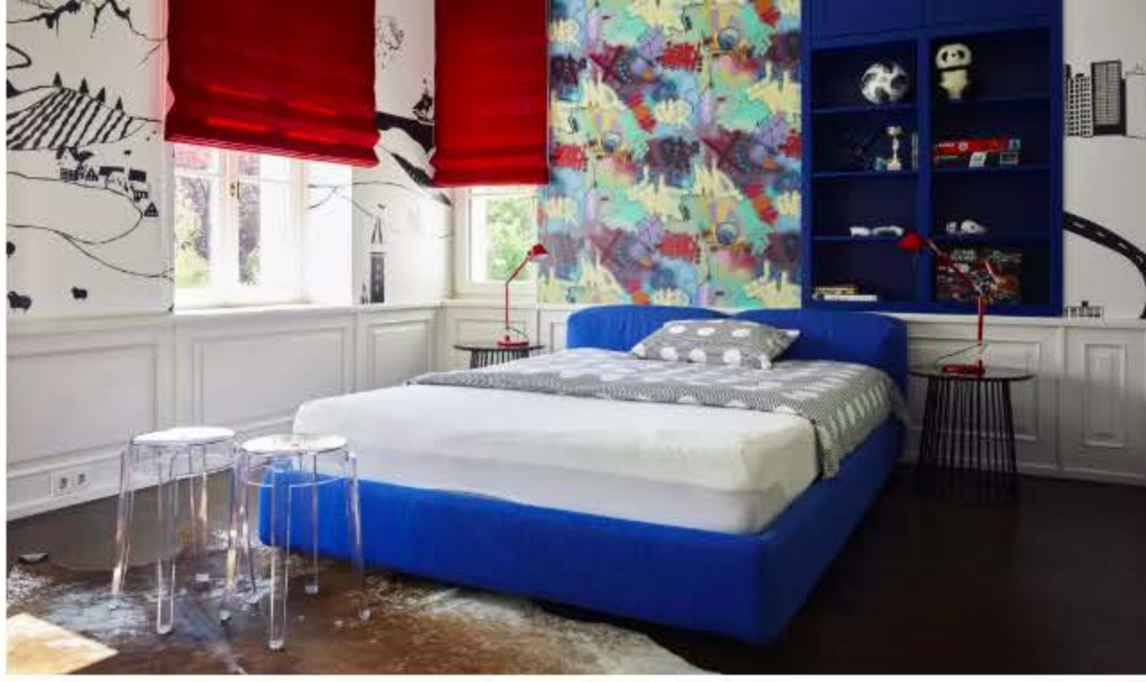
为家中三个孩子打造卧室时，设计师结合他们的年龄和爱好做了个性化的墙面设计：哥哥的房间呈简约的蓝色，弟弟的房间则多了些缤纷墙纸及彩绘。