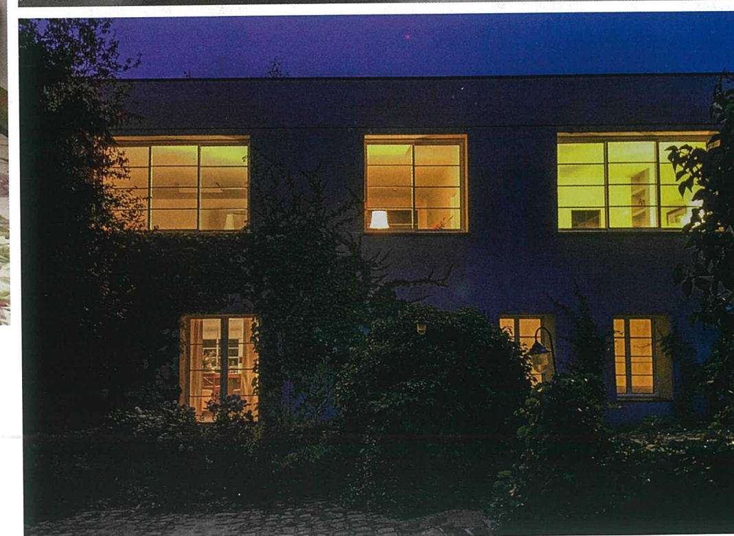
A SINISTRA, LA CAMERA DA LETTO IMPREZIOSITA DA CIMELI DI FAMIGLIA E A DESTRA, L'AMBIENTE BAGNO CON UNA VASCA IN CORIAN DELLA TEUCO, ILLUMINATO DA UNA FINESTRA AL SOFFITTO. IN BASSO, L'EDIFICIO FOTOGRAFATO DI NOTTE. LEFT: THE BEDROOM BOASTING SEVERAL FAMILY HEIRLOOMS. RIGHT: THE BATHROOM WITH A TEUCO CORIAN BATHTUB, ILLUMINATED BY A ROOF WINDOW. BOTTOM: A NIGHT-TIME VIEW OF THE HOME.

solo il legno può dare con il centro completamente in cemento”) e nei bagni. I pavimenti, sotto i quali è stato collocato il riscaldamento, sono in parte ricoperti di parquet in massello di rovere nell’area notte al primo piano. Le porte, le librerie e il tavolo da pranzo in cucina, come anche le travi al soffitto, sono stati disegnati da Tordiglione e in parte realizzati da bravi ebanisti portoghesi. I muri perimetrali sono stati colorati da pietre e quarzi, incastrati su idea del proprietario, che ha