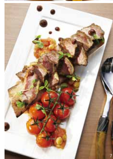
1. 看著牆上的機械使用說明與烹飪方式，與口中的千萬滋味有異曲同工之妙。2. 牆上的書都是Sal Curioso發明的料理。3. 機械圖的精確程度令人驚嘆；在牆上是美麗的裝飾，縮小就成為桌上的杯墊，同樣可以組合拼貼出完整機械圖。4. 每件發明都有專屬吊牌，而這也正是餐廳的名片。5. 坐在二樓露台可以俯瞰蘭桂坊與中環美景。6. 7. 澳洲籍主廚的新創菜單，同樣是讓人驚喜連連。