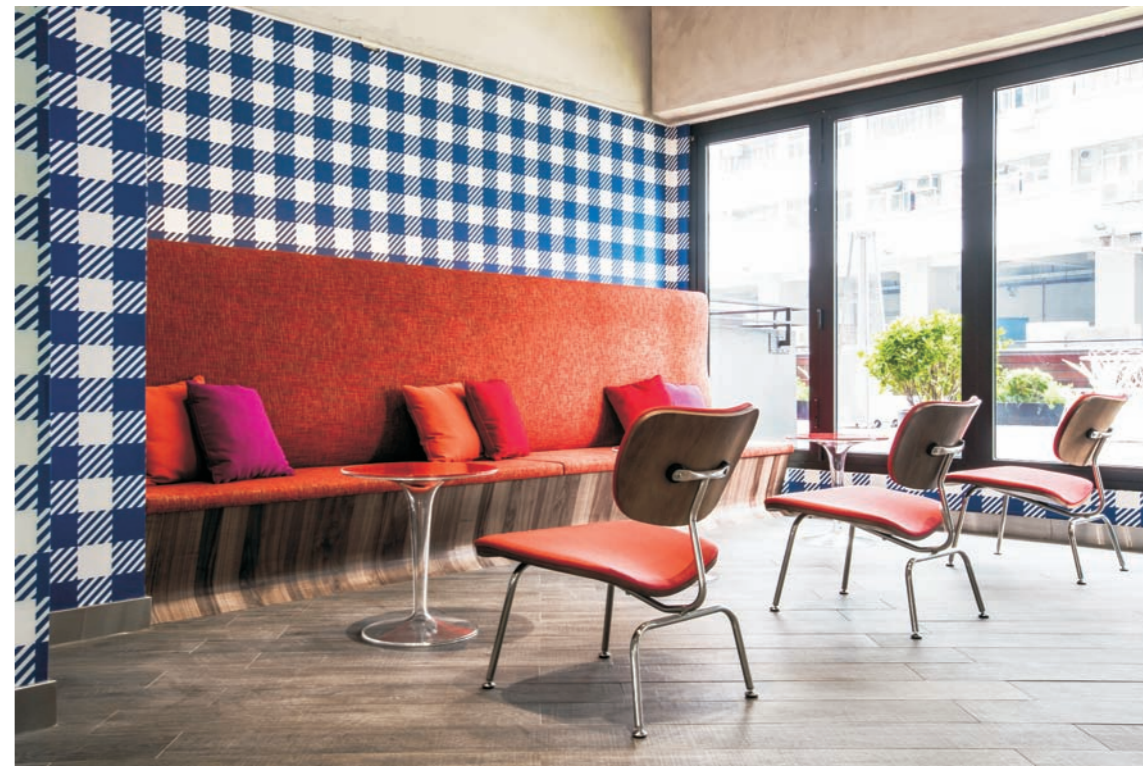
5 8 图5 极具时代特色的波浪型沙发和书架 6 7 图6、7 创意休息区 图8 茶水间

的环境的化身。空间运用了60年代常用的三原色彩，满载设计色卡的基本色调，配饰代表着那个时代文化特色的长型波浪沙发，整个设计亦因墙上的简单条纹而生色不少。