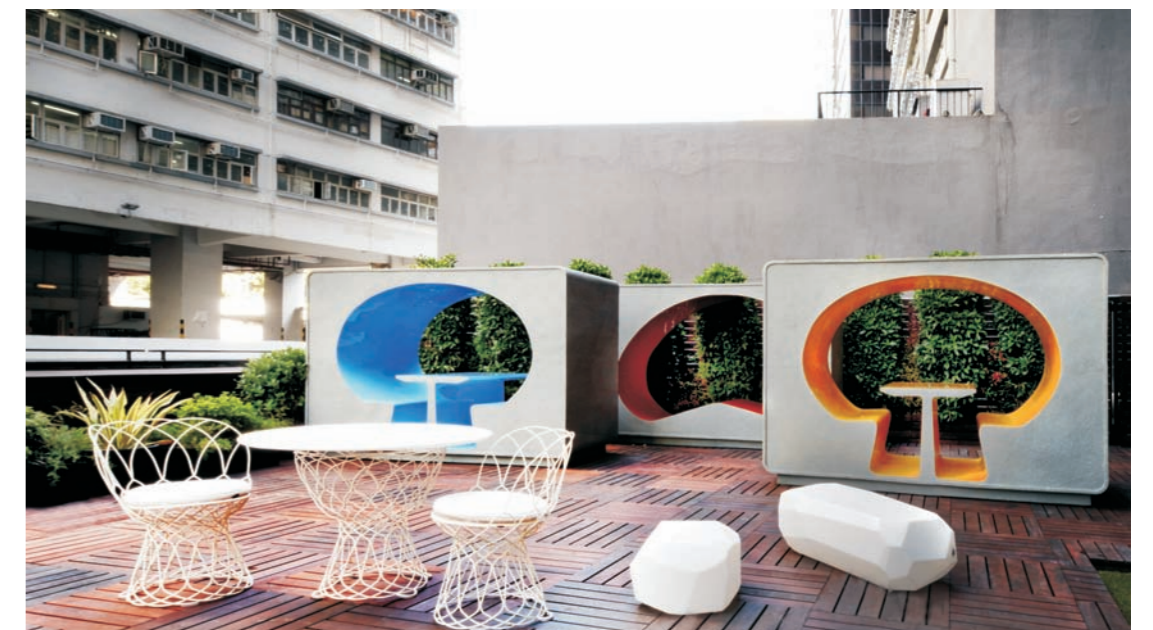
9 11 图9、10 停车场 10 12 图11、12 户外露台休息区

作为一个专为香港而设立的独立而活泼的工作空间，Genesis致力于透过其充满创意的设计，启发创新与创造力，从而带出工作与生活平衡的新思维。M