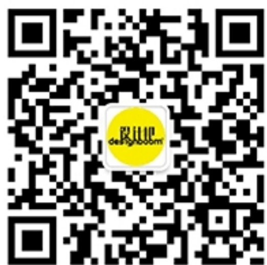
设计邦微信公众号