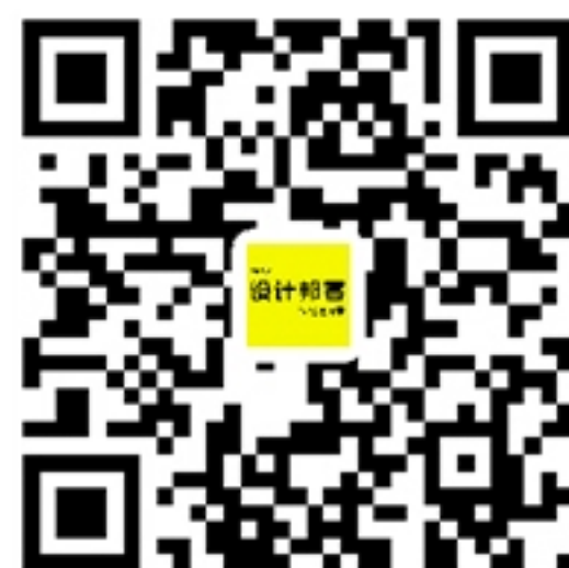
扫码加入设计邦客

设计邦客是以设计行业媒体、教授、学生、设计师、材料商、渠道商为主体，倾力打造中国最大的设计师实名通讯录。