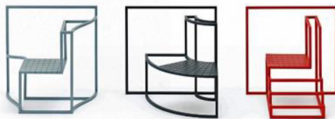
椅子系列「Shadows in the windows」概念源自香港住宅的窗框，可惜不會生產，只作展覽用。