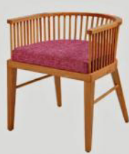
與家具公司合作設計的 Eva 系列，重要的細節，設計概念來自小時候在拿坡里的生活點滴。