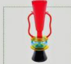
展覽將展出意大利大師 Ettore Sottsass 設計的作品，Ettore 是 20 年代設計團體 Memphis 的領導者，用大膽的色彩、誇張圖案以及廉價的塑料塑膠，展現當時的理性主義設計。