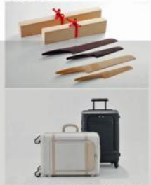
行李箱「Fourt」實用而美觀，可以直向或橫向擴展。