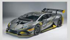
今年新設計 Huracán Super Trofeo Evo

如何從傳統中找到新的設計靈感？ ■ 我們常思考著如何與時俱進創造未來，其中一個例子是 Super SUV URUS，因為其創新的比例，這將會是市場上最漂亮的 SUV。我們也應用了一些林寶堅尼 LM002 舊有的元素，例如前輪、精細的車輪與車身三角引出出口，都是新穎和令人驚喜的設計。