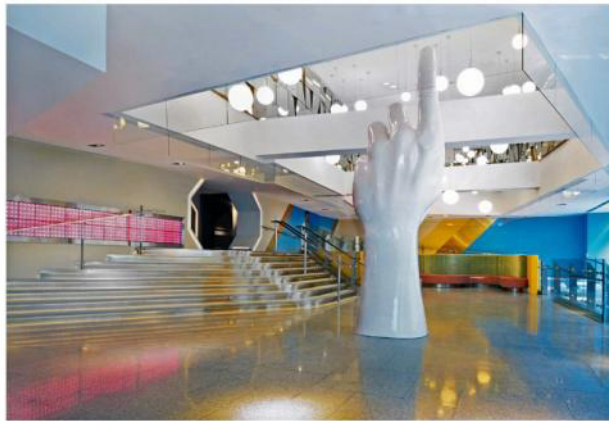
Genesis 大廈大堂的巨型手雕塑，展現出設計師對空間的想像，再一手一手地雕琢出來。