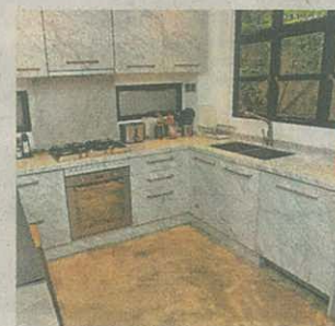
■廚櫃由原件灰白雲石做，紋理細緻完整。