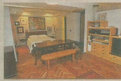
■原則三房拆通，空間感大增。