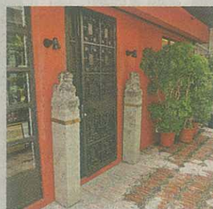
■前庭鋪六角形拼菱形磚片，配襯一對中國石獅。

單位的前庭佈置匠心獨運，棄掉原裝四方形瓷磚，嫌它不夠古舊，找來二手陳年地磚，磚片有六角形拼菱形的圖案，恍如時代倒流民初時期，大門擺放一對古色古香的中國石獅，歡迎客人到訪。