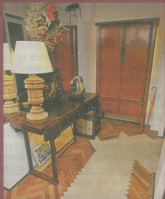
■地板改為人字鋪法，玄關處加入水泥，做出老舊又帶粗糙的感覺。

改動後，偌大的空間供戶主擺放多組古典家具、裝置藝術及特色繪畫，琳瑯滿目，饒富姿采。訂做入牆家具簡而精，玄關的黑色金屬層架櫃，用來放零碎飾物及書本，充當小型展示區，套房窗前途空做銅片書枱，可對着後花園書寫閱讀，衣櫃繫淺灰色及鑲線飾，連套廁入口做同款隱藏門，刻意的素淨，好讓視線落在藝術品上。