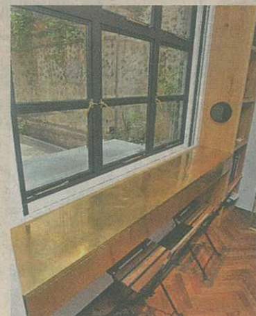
■單位加入金屬元素，煥發當代建築及流行的工業味。