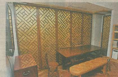
■客飯廳與套房之間活動屏風，正面是木製中式圖案，後面是日本布料。