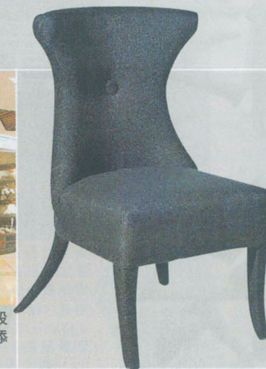
Slate Linen Dining Chair

■擁有古董外貌元素的椅子，用上了柔軟式物料設計，單是看外貌已讓人有躺在梳化歇息的舒服感覺，椅背設計按腰椎的線條設計，令人有欲望坐上去。其不設扶手的設計，可以減低笨重的感覺，而四隻椅腳垂直設計，取而代之的是流線型椅腳，添加靈活有趣的外貌。