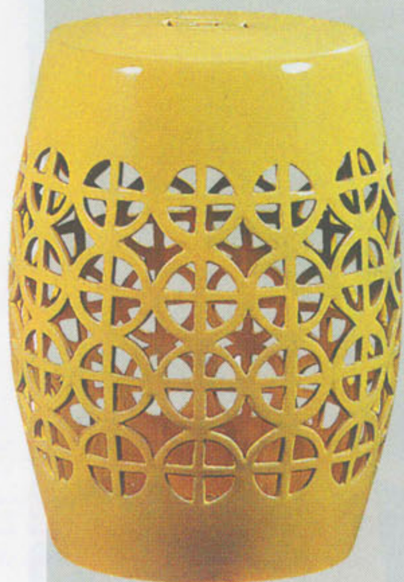
Ceramic Lattice Yellow Stool

■以黃色作為主調的圓凳，擁有中國式的風格，以仿金錢形的構圖，是中國家具常用的圖案，無論顏色及花紋都有富貴的寓意。設計師把經典外形的凳子，用上了陶瓷雕刻，既實用，又耐用，可放在玄關讓客人整理鞋履。