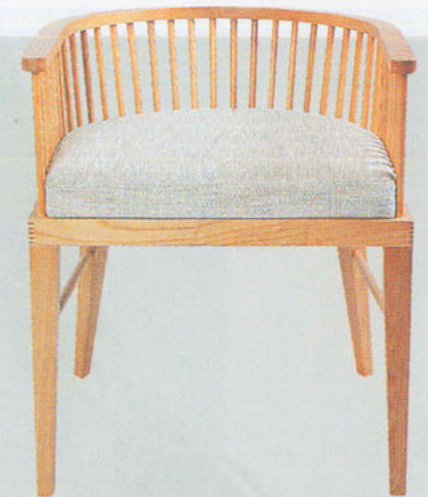
Eva Dining Armchair

■相信無人不認識錦鯉，錦鯉被視為一種風水魚，在中國傳統的文化中，牠代表了富貴與吉祥，過年時會說「年年有魚」、「鯉躍龍門」。錦鯉身上的紋理以紅橙色居多，有「紅運當頭」的感覺，故不少藝術家會以錦鯉作為題材，這系列錦鯉圖案的餐具，紅色的錦鯉印在白色的餐具中，猶如在白畫紙上繪畫，清麗脫俗。