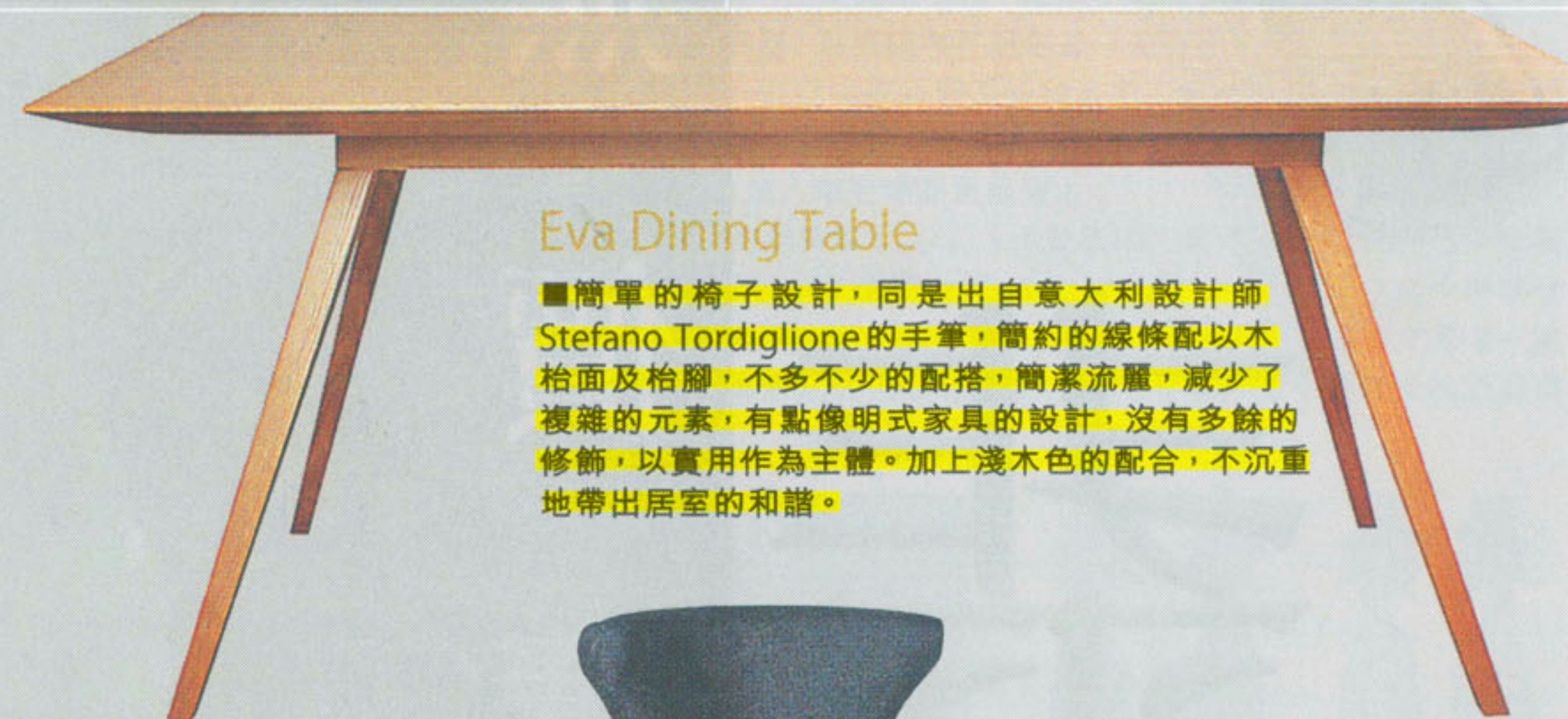
Eva Dining Table