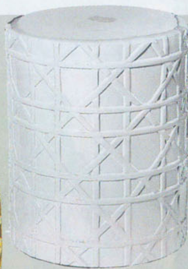
Ceramic Bamboo White Stool

■以黃色作為主調的圓凳，擁有中國式的風格，以仿金錢形的構圖，是中國家具常用的圖案，無論顏色及花紋都有富貴的寓意。設計師把經典外形的凳子，用上了陶瓷雕刻，既實用，又耐用，可放在玄關讓客人整理鞋履。