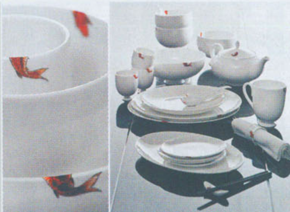
Tattoo Temple Koi Fish Tableware Collection

■竹凳是自古以來中國流行的家具之一，古人採用竹作建材，好處是竹的生長比木材快，且物料不太吸熱，在古時沒有冷氣的夏天也用得上。設計師取其外觀作意念，換上陶瓷的物料，再髹上白色，然而保持圓凳的中式設計，配上典型的竹凳細紋，帶出不一樣的感覺。